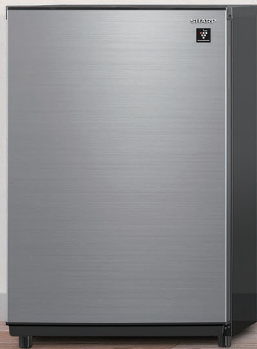
FJ-HM7K-H (メタリックグレー)