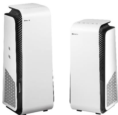
左：Blueair Protect 7500 / 右：Blueair Protect 7300

スウェーデン発の高性能空気清浄機「Blueair（ブルーエア）」の日本総代理店、セールス・オンデマンド株式会社（本社：東京都千代田区 / 代表取締役社長 室崎 肇：以下、セールス・オンデマンド）は、ウイルスや菌への対応力を高めたフラッグシップシリーズ「Blueair Protect」に適用床面積*1 ～55畳の「Protect 7540i」「Protect 7510i」と適用床面積*1 ～29畳の「Protect 7340i」「Protect 7310i」の4モデルを本日2022年2月10日（木）より全国の家電量販店、一部百貨店、ブルーエア公式ウェブサイト（ https://blueair.jp/ ）及び一部オンラインショップにて発売いたします。